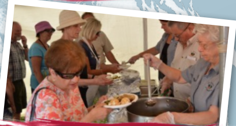
Soupers de Lasagne et Poulet