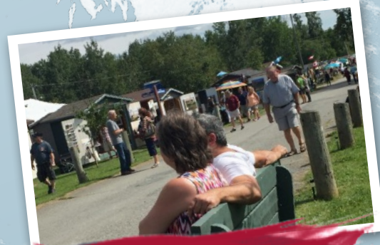
Témis Country Band